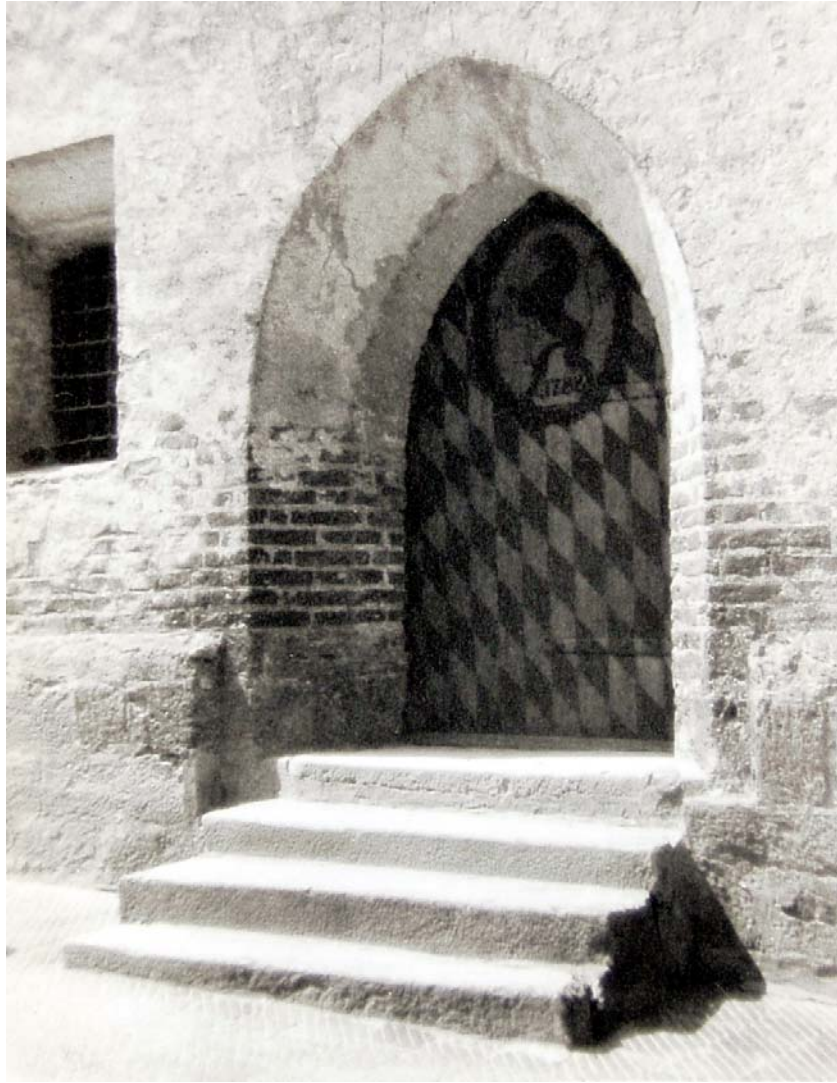
Ehemaliger Eingang zum Brothaus/Waage von der Salzsenderzeile. (Zugemauert 1933)