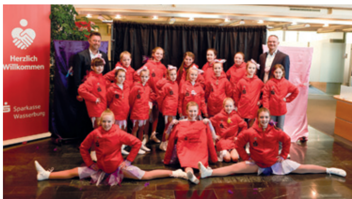
Foto: Robert Minigshofer und Andreas Bonholzer mit den Tanzstrolchen und Teenies der Stadtgarde Wasserburg.

Als kleines Dankeschön führten die Tänzerinnen im Beratungszentrum der Sparkasse Wasserburg ihr zauberhaftes Programm „Im Land der Phantasie“ auf. Die zahlreichen Zuschauer/-innen staunten über den tollen Auftritt und applaudierten kräftig. Zum Abschluss gab es für die Mädchen und Gäste noch eine kleine Stärkung mit Krapfen und Getränken. Die Sparkasse Wasserburg bedankt sich bei den Tanzstrolchen und Teenies der Stadtgarde Wasserburg nochmal ganz herzlich für den tollen Auftritt.