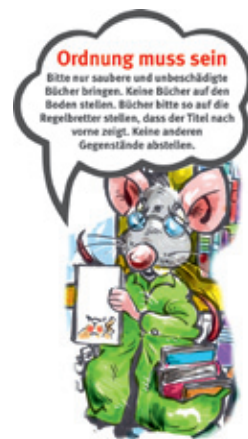
Illustration: R. Reindl

Die Leserrate bittet um Beachtung der „Spielregeln“.