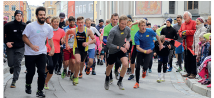
Start des Hauptlaufs.

Spaß für die ganze Familie & Sportbegeisterte! Anmeldung jetzt möglich