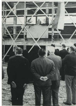
Das „Richtfest“ wird gefeiert.