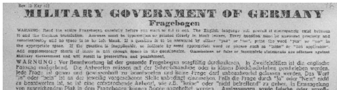
Abbildung 1: Kopf des OMGUS-Fragebogens

Die Mitglieder der Spruchkammer setzten sich aus Klägern, Vorsitzenden, Beisitzenden und Ermittlern zusammen. Sie waren allesamt als Entlastete eingestuft worden oder vom BefrG nicht betroffen. So könnte man meinen, eine Kammer bestand fast ausschließlich aus Angehörigen von ehemaligen Oppositionsparteien 165 . Doch wirkten in Wirklichkeit größtenteils Nichtparteimitglieder in einer Spruchkammer mit. Das soll in folgender Tabelle veranschaulicht werden.