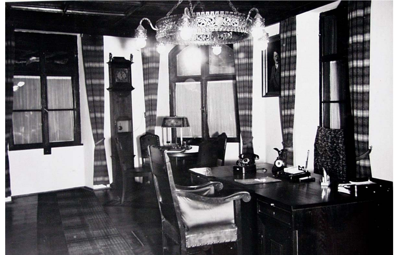
Das Bürgermeisterzimmer nach der Neugestaltung im Jahr 1936