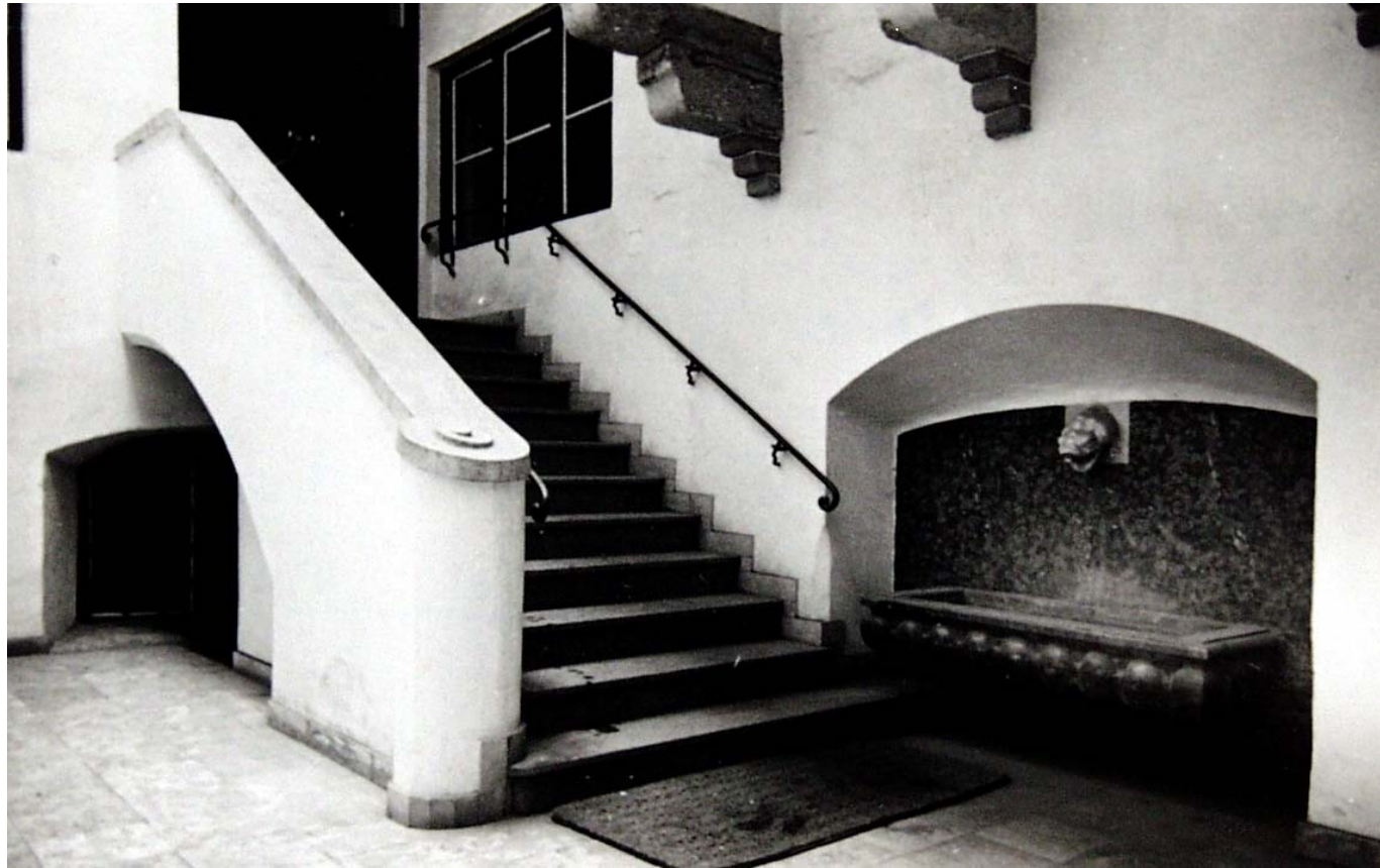
Innenhof und Treppenaufgang zu den Verwaltungsräumen nach der Neugestaltung im Jahr 1934