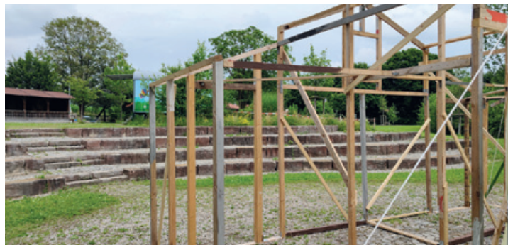
Das Bühnenbild im schönen Amphitheater bei Babensham ist schon fast aufgebaut

Vom 14. Juli bis 14. August spielt das Theater Herwegh an drei bezaubernden Orten: im Schlosshof Haag, im Amphitheater des Babenshamer Mehrgenerationengarten, im Kurpark Bad Endorf.