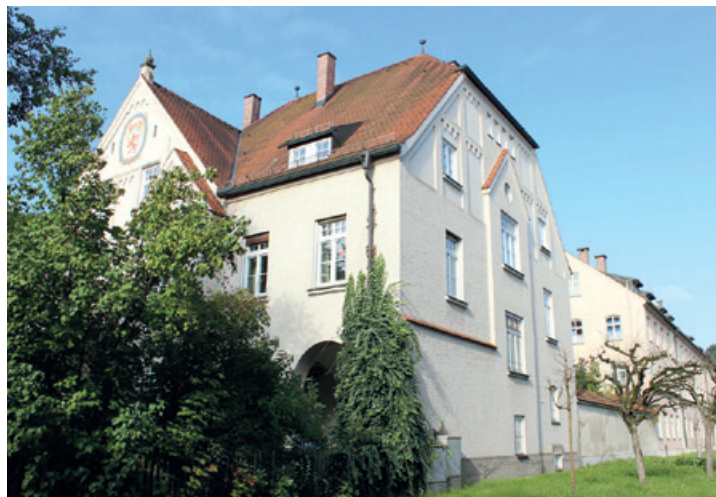
In diesem Gebäude am Kaspar-Aiblinger-Platz war der Wasserburger Integrationshort seit dem Sommer 1995 untergebracht.

Der Hort in Pfaffing wurde 2011 eröffnet und betreut derzeit 33 Kinder in zwei Gruppen, darunter zehn Integrationskinder mit erhöhtem Förderbedarf. Entgegen dem Trend in Wasserburg verzeichnet Sarah Kern hier sogar eine erhöhte Nachfrage.